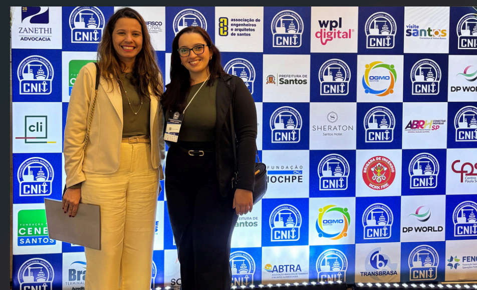
Congresso Nacional Integra Portos