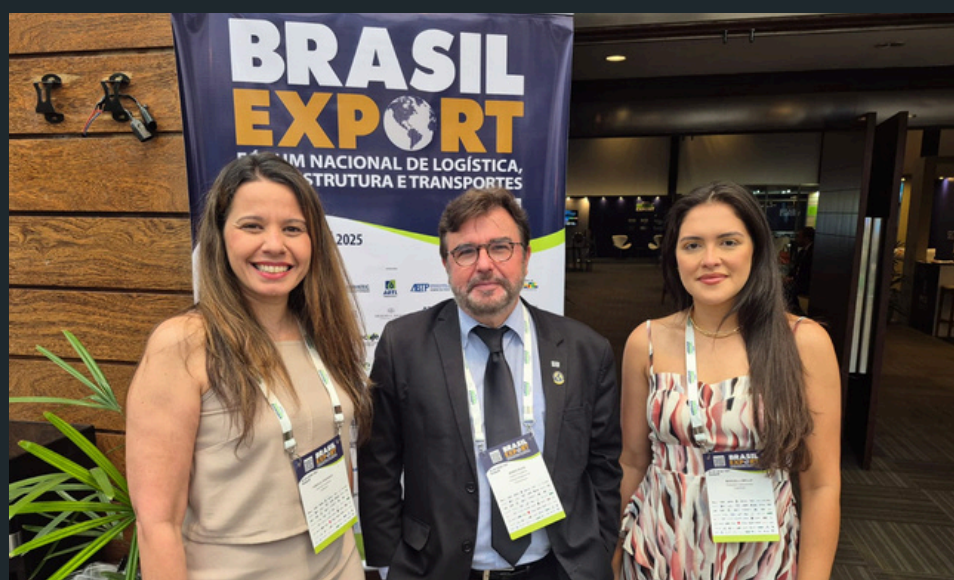
Fórum Nacional Brasil Export