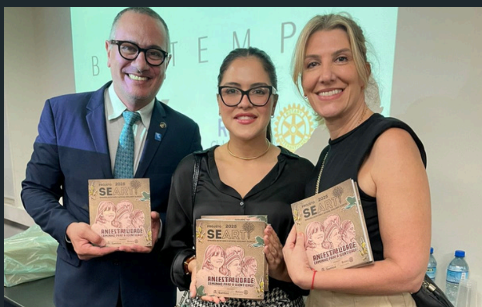
Lançamento do livro: Projeto SeArt