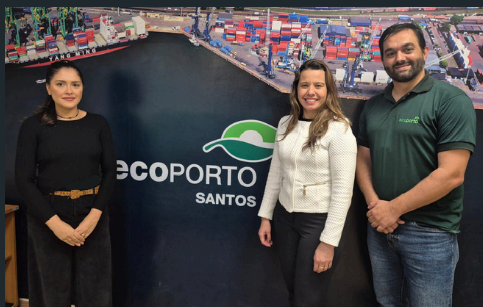
Visita à associada EcoPorto